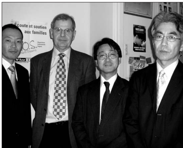
En Novembre 2006, l'APEV accueille dans ses locaux, une délégation du ministère de la justice japonais.

Dans le cadre d'une mission de recherche sur les infractions sexuelles en France, l'APEV a reçu en novembre 2006, dans ses locaux, une délégation du ministère de la justice japonais.